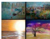
Una pincelada, dos pinceladas...la explosión del color Clausurada el 12 de noviembre de 2017

La muestra reúne las obras de cuatro artistas de Argentina, Francia y España, que dialogan con sus propias miradas. [ver+]