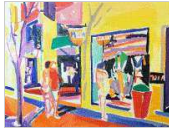
Begoña Summers Pinturas y dibujos Clausurada el 29 de diciembre de 2017

Exposición de la obra bibliográfica de Carmen de Burgos en el 150 aniversario de su nacimiento. [ver+]