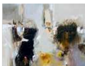
Unique Realities Clausurada el 15 de octubre de 2017

Exposición de Estrella Cuadrado y Paco Sainz "Palabras esculpidas". Escultura y Poesía. [ver+]