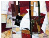
Jorge Morgan Recorrido Vital Clausurada el 14 de enero de 2018

La exposición "Desde Estambul con cariño" de Devrim Erbil muestra las obras de uno de los representantes más importantes del arte abstracto del arte contemporáneo turco, conocido como el "poeta de la pintura". [ver+]