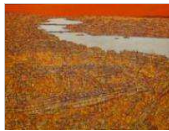
Devrim Erbil Desde Estambul con cariño Clausurada el 30 de enero de 2018

La exposición "Desde Estambul con cariño" de Devrim Erbil muestra las obras de uno de los representantes más importantes del arte abstracto del arte contemporáneo turco, conocido como el "poeta de la pintura". [ver+]