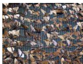
Palabras esculpidas Estrella Cuadrado y Paco Sainz Clausurada el 30 de octubre de 2017

La Naturaleza es bella, es perfecta, tratemos de conservarla en estos tiempos tan difíciles y de tantos cambios. [ver+]