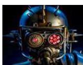
Javier Tresguerres Enmascarados Clausurada el 30 de septiembre de 2017

Más de 50 artistas de 19 países se dan cita en los dos espacios expositivos del Ateneo: Sala Prado y Espacio Prado. [ver+]