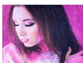
Art of Somoza de Ivan M.I.E.D.H.O Clausurada el 29 de septiembre de 2017

La muestra está compuesta por 53 fotografías de cuerpos desnudos que, sin embargo, ocultan sus rostros con extrañas máscaras y artefactos que, en ocasiones, los asemejan a seres biomecánicos despojados de alma. [ver+]